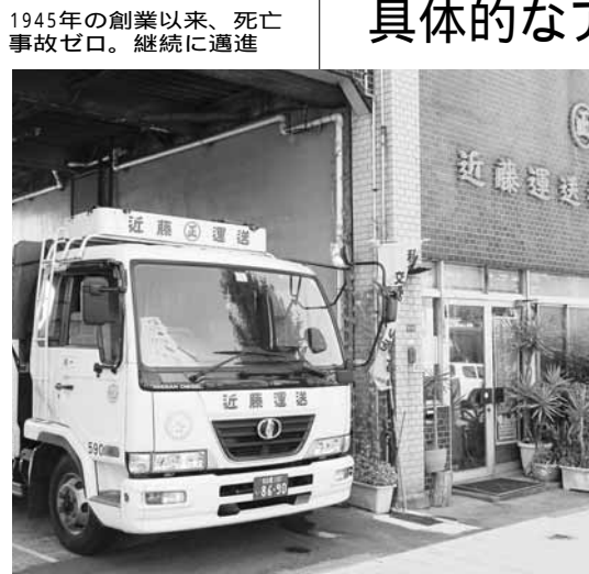
1945年の創業以来、死亡事故ゼロ。継続に邁進

安全への社内理念に押し指す。安全への社内理念に押し指す。安全への社内理念に押し指す。