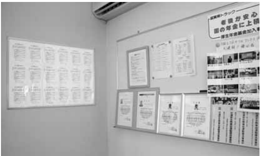
応接コーナーに全社員の安全運転宣言書を掲示

「事故を起こした者に罰を与えるより、インセンティブで従業員一人ひとりのやる気を喚起するほうが効果的」というのが同社の安全対策の基本。